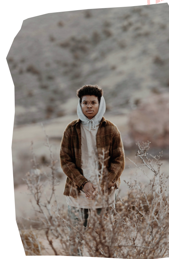
Nous publions l'histoire « Les hôtes de la Villa des bois » de L.V. Davidson avec l'aimable autorisation de « Lutterworth Press » (GB) et de « EBLC » (Suisse)

poli et reluisant, la bouilloire chante sur une plaque antique près du feu. La nappe propre et de couleurs vives met en valeur les tasses et les assiettes avec leur motif de saule. Les géraniums fleurissent devant la fenêtre. Un gros chat de gouttière se nettoie le museau sur le tapis gai.